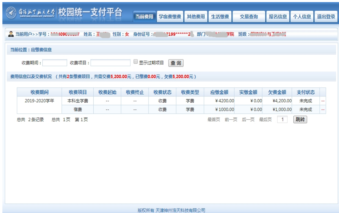
图 3.3-1 欠费显示