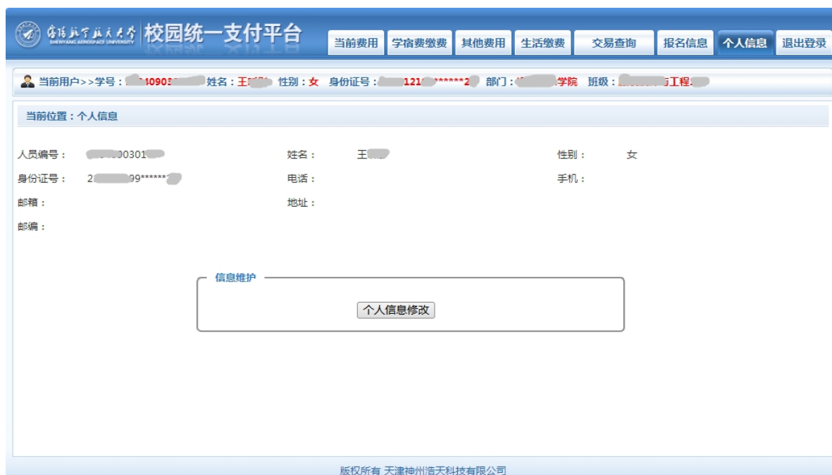
图 3.2-1 个人信息维护界面

登陆支付平台后，点击导航栏的“个人信息”按钮，显示个人信息确认及维护界面。如图 3.2-1 所示。 请确认个人信息无误后再进行缴费，避免误交费。