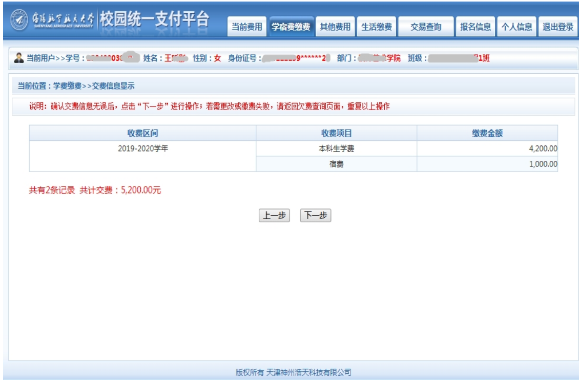
图 3.4-3 缴费方式选择