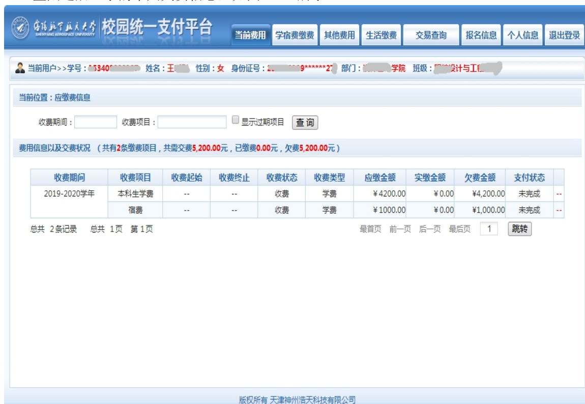
图 3.1-2 统一支付平台登陆后页面