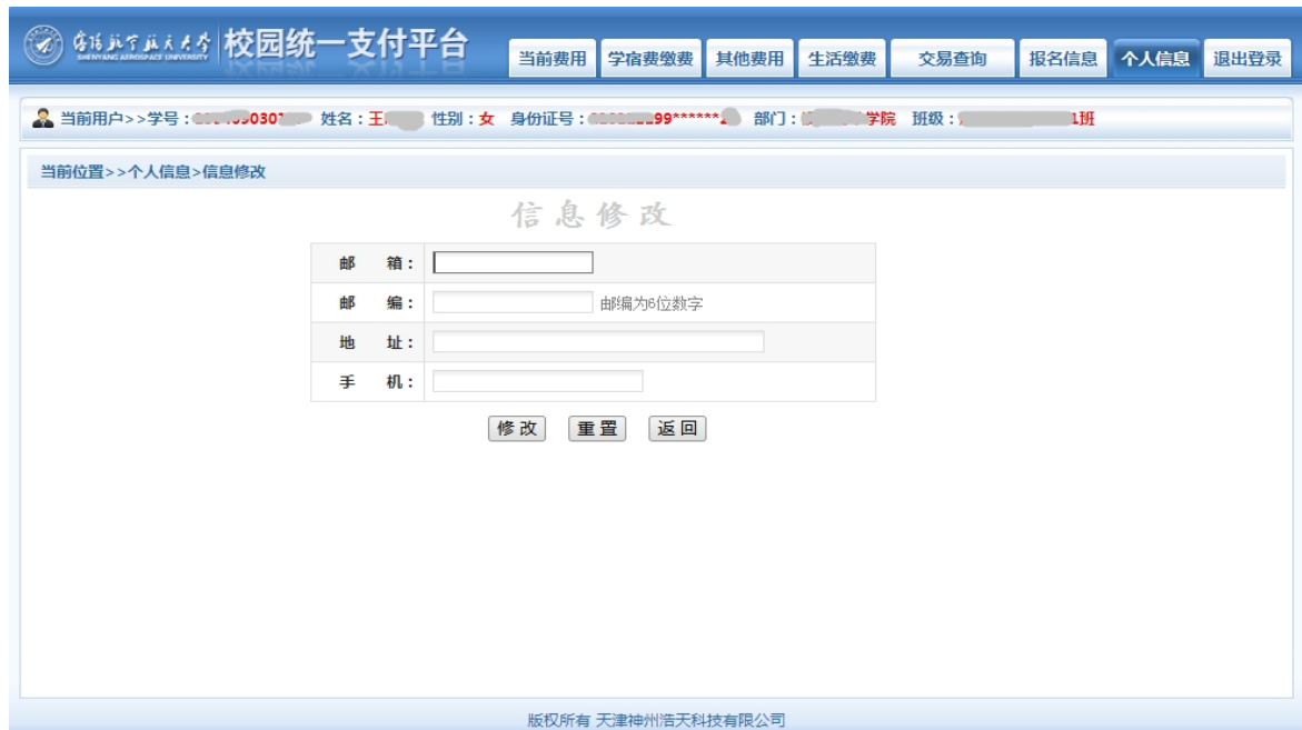
图 3.2-2 个人信息修改

点击个人信息界面的“个人信息修改”按钮，显示 3.2-2 所示的个人信息维护界面。在相应的输入框，输入需要修改的个人信息，点击“修改”按钮，完成个人信息维护。未保存前，点击“重置”按钮，还原个人信息。