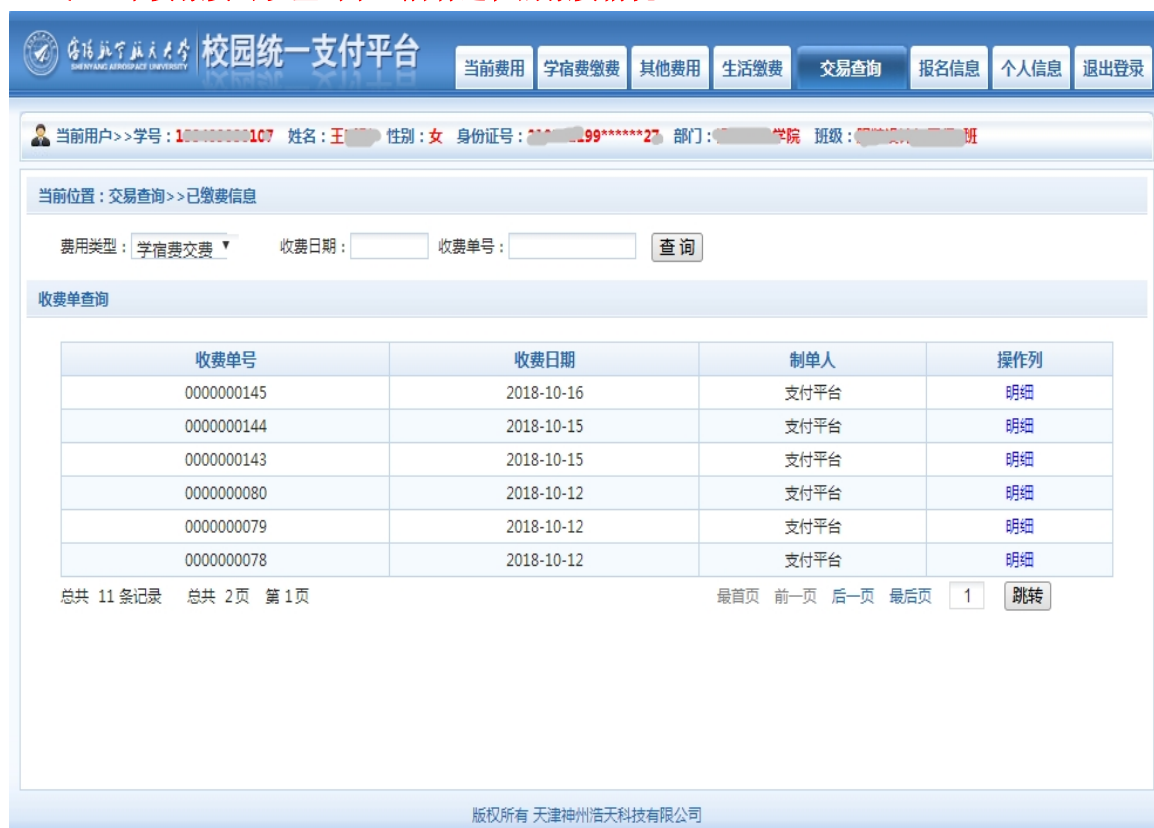
图 3.6-1 已缴费信息显示