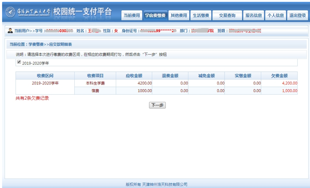
图 3.4-1 学宿费欠费信息

点击导航栏的“学宿费缴费”按钮，显示学费欠费和选择页面，如图 3.4-1 所示：