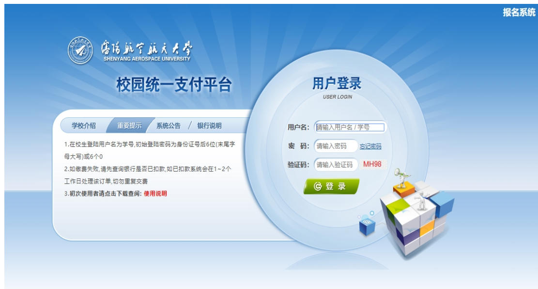
图 3.1-1 统一支付平台登陆界面

缴费时，请在浏览器地址栏中输入网址 http://jccpay.sau.edu.cn 或通过沈阳航空航天大学计处网站 http://cwc.sau.edu.cn/ 中的“校园统一支付平台”浮动窗口链接进入，如图 3.1-1 所示。进入界面后，请确认支付网站地址是否正确。