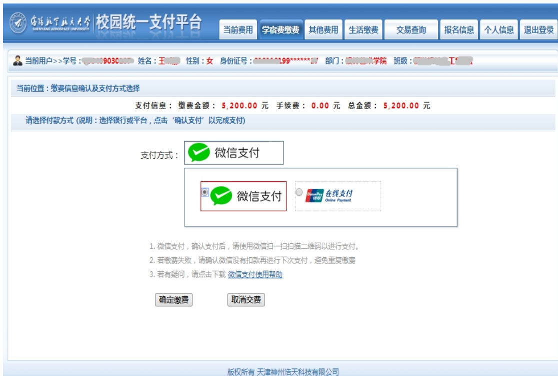
图 3.4-4 缴费方式选择