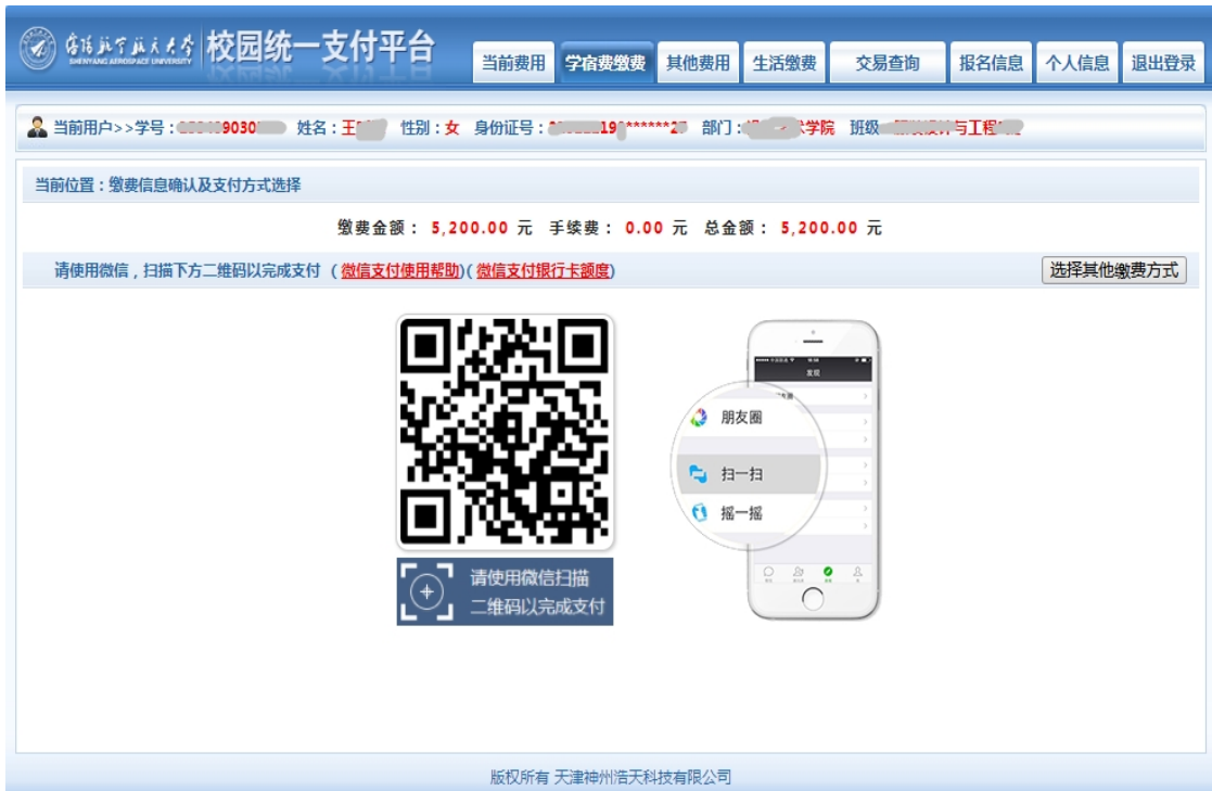
图 3.4-5 微信支付

如图 3.4-4 所示，确定支付金额无误后，选择微信支付，进入如图 3.4-5 所示：