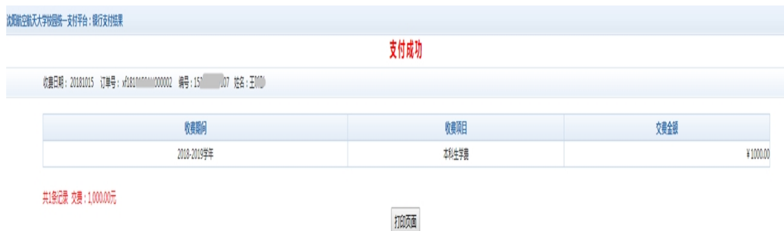
图 3.5-3 缴费凭证